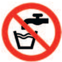
Abbildung 2: Zeichen für „Kein Trinkwasser“

Nichttrinkwasserleitungen sind nach der Trinkwasserverordnung und nach DIN 2403 eindeutig und dauerhaft farblich unterschiedlich zu kennzeichnen, damit es zu keiner Verwechslung kommt. Alle Entnahmestellen der RWNA sind mit einem Schild „Kein Trinkwasser“ oder dem Bild (Abb. 2) zu kennzeichnen.